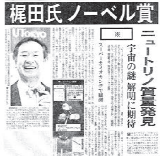
(読売新聞 朝刊 1面 平成27年10月7日 一部改変)